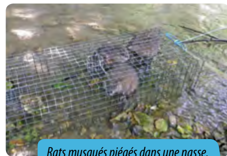
Rats musqués piégés dans une nasse.

i Les syndicats de bassins versants RECHERCHENT DES PIÈGEURS de rats musqués et de ragondins. Prime de 1€ de la queue et possibilité de valorisation des fourrures . Pour plus d'informations, contactez le technicien rivière du syndicat de bassin versant.